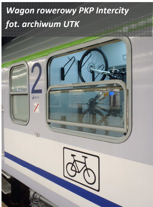
Wagon rowerowy PKP Intercity

Pasażer zajmuje miejsce w tym samym wagonie, gdzie w wydzielonym i oznakowanym miejscu jest przewożony jego rower (zwykle umieszczony na wieszaku). Przeszkłone drzwi do przestrzeni bezprzedziałowej lub okno w ścianie przedziału pozwalają obserwować, czy rowery podróżują bezpiecznie.